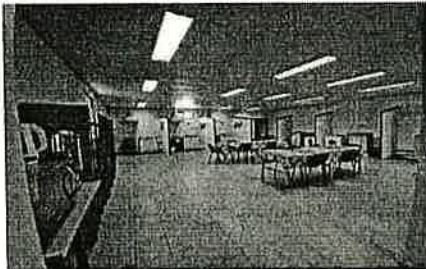
Fotografías del inmueble